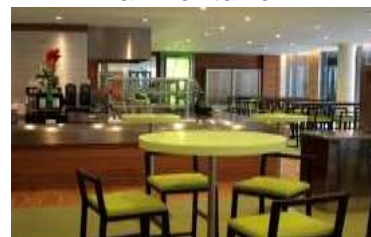
Tables et mobiliers en restauration