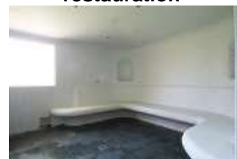
Hamam - sauna