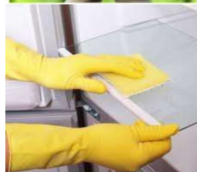
Matériel réfrigérant alimentaire